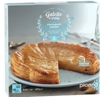
ガレット・デ・ロワ