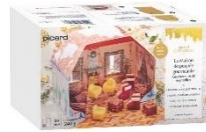
小さなおかしの家

通常税込価格 3,219 円[700g(約6皿分)] 税込価格 2,679 円[240g]