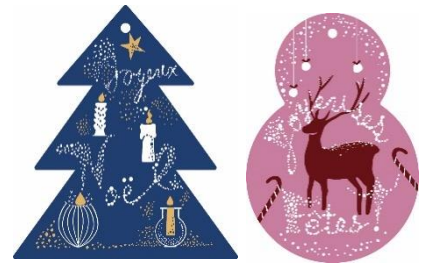
ペーパーオーナメントイメージ

人気イラストレーターの米澤よう子氏がピカールのために描き下ろした、メッセージカードとしても使えるペーパーオーナメント2枚セットをプレゼント。