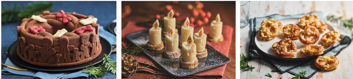
写真左から、ファビュルーズ ファランドール / キャンドル (レモンクリームと克蘭ブル) / ミニプレッツェル・オ・フロマージュ

【12月のテーマは“みんなが幸せ。フレンチ・クリスマス”】 プチ贅沢なキャビアやキャンドル型デザートなど、クリスマス限定商品が登場！ パーティー、家族、少人数など、タイプで選べる限定セットを4種類ご用意 ピカールで作る“わたらしいクリスマス”をご提案 約380種類の“本格冷食”で、クリスマス直前の“駆け込み需要”にも対応 フランスの新年定番スイーツ「ガレット・デ・ロワ」を予約販売開始 https://www.picard-frozen.jp/