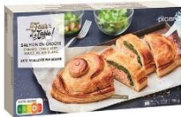
サーモンのパイ包み焼き