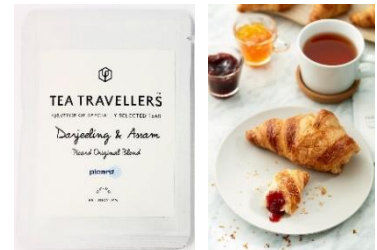
▲オリジナルブレンドティー／クロワッサン

内容：キャンペーン期間中に「クロワッサン」2個以上または 「クロワッサン」と「ミニクロワッサン」の合計2個以上のお買い上げで、 Picardのクロワッサンにあわせて特別にブレンドした、 オリジナルブレンドティーをプレゼントします。※在庫がなくなり次第終了