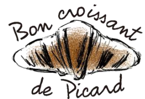
▲“ピカクロデー”ロゴ

内容：毎月6のつく日(6日/16日/26日)は“ピカクロデー”で 「クロワッサン」と「ミニクロワッサン」が100円OFFになるお得な日。 さらに、“ピカクロデー”にしかもらえないシールを6枚集めると、 オリジナルグッズがもらえる、ピカクロファンのためのスペシャルな日。 キャンペーン期間中は毎日“ピカクロデー”を開催。