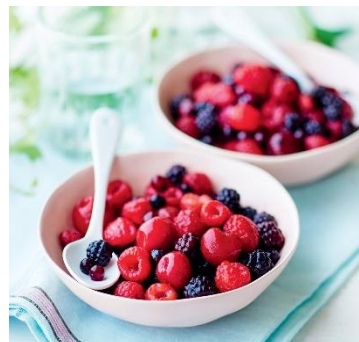
写真左から、「クロワッサン」と「パンオショコラ」/「パンケーキ」と「BIO マンゴー(角切り)」/「フルーツサラダ(赤いフルーツ)」

イオンサヴール株式会社が展開する、美味しさと品質にこだわる冷凍食品専門店 Picard(ピカール)は、3月23日(月)から4月19日(日)まで“カラフル朝ごはん”をテーマに、Picardのパンと食材で叶える、新生活にぴったりな彩り豊かでお手軽な朝食をご提案します。