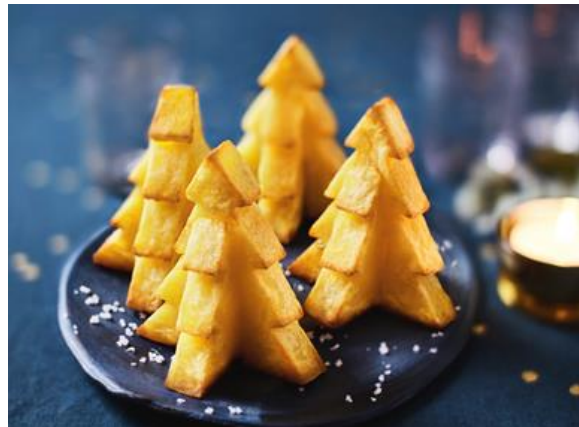
写真左から、「星夜のクリスマス」キービジュアル / 「小さなモミの木」イメージ

イオンサヴール株式会社が展開する、美味しさと品質にこだわる冷凍食品専門店 Picard(ピカール)は、11月26日(月)から12月25日(火)まで“星夜のクリスマス/NOËL SOUS UNE BONNE ÉTOILE”をテーマに、クリスマス限定商品約20種類を順次発売します。