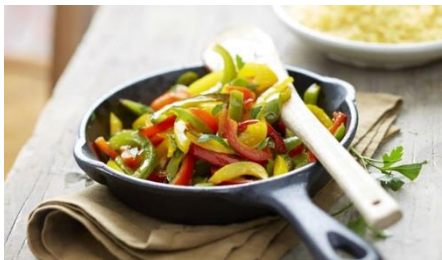
パプリカミックス