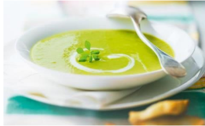
パルミジャーノ・レッジャーノと グリーンアスパラガスのクリームスープ