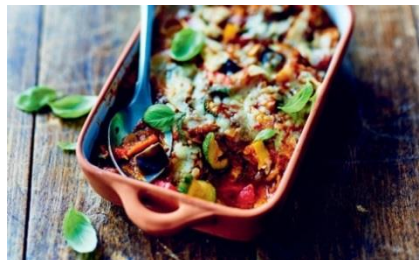
南仏野菜のグラタン