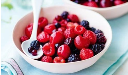
フルーツサラダ（赤いフルーツ）