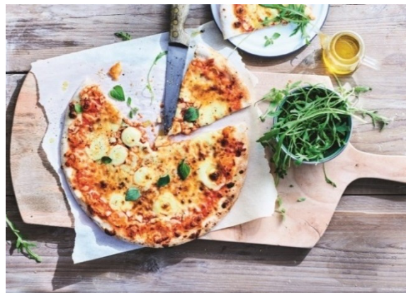
写真左から、“今日は、わたしがコックさん！” キービジュアル / ピッツァ マルゲリータトラディショナル

イオンサヴール株式会社が展開する、フランス No.1 冷凍食品専門店「Picard（ピカール）」は、7月24日（月）から8月27日（日）まで、“今日は、わたしがコックさん！～LE CHEF, C' EST MOI !～”をテーマに、お子さまでも簡単に料理を楽しむことができる、夏のイージークッキングをご提案します。同期間中は、朝食から夕食まで、暑い夏でもメニューを考えるのが楽しくなる商品を、一部特別価格にてご提供します。